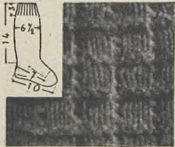
Esquema del punto.

centro de la parte de atrás del trabajo (dejad los 23 puntos restantes en espera), para formar la parte superior del pie. 3.º Haced los 25 puntos en punto de jersey, volviendo sucesivamente hasta haber trabajado 16 vueltas. 4.º Para formar el taloncillo poned sobre una aguja 5 puntos, 2 de derecha y 2 de izquierda, situado en el centro del talón; poned sobre una segunda aguja los 10 puntos que quedan a la derecha del talón, y sobre una tercera los 10 que quedan a la izquierda del talón. 5.º Terminad el taloncillo sobre el derecho del trabajo: a) Haced 2 puntos de la segunda aguja, excepto el último. b) Coged juntos el último punto de la segunda aguja con el primero de la primera (primera disminución del lado derecho del taloncillo). c) Haced los puntos de la primera aguja (centro del ta-