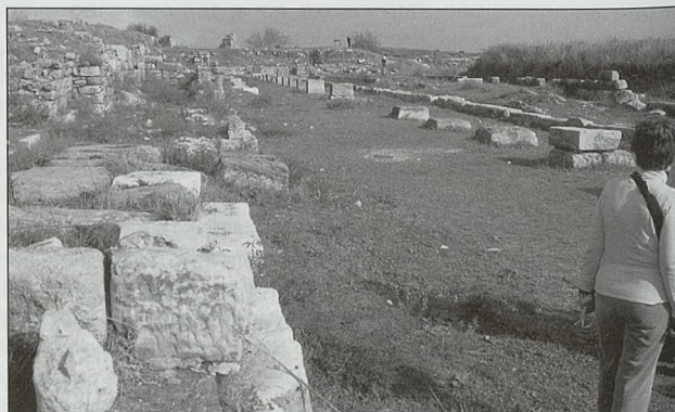
Mileto, almacén helenístico

Tras ese monumental pórtico/stoa, al sur, en medio de ambos barrios, se encontraba el corazón de la ciudad, formado por las grandes construcciones públicas, el "Ágora norte" y el "Bouleterion" al oeste y, frente a ellos, al este, separados por la gran "Via procesional" o del lujo, al sur del Delfinión, se alzaban sucesivamente las "Termas de Cneo Virgilio Capito", proconsul de Asia con el emperador Claudio, el "Gimnasio helenístico", el "Ninfeo" romano, del s. II d. de C., y, tras él, una "Basílica" romana del siglo V d. de C. que será luego la "Catedral bizantina".