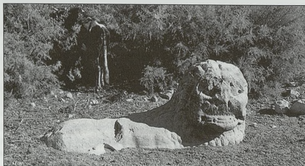
Mileto, león del puerto

os habitacionales, el nordeste, que era el mayor, alargado y relativamente estrecho, con forma de huso, y el noroeste, menor y más rectangular, el "barrio del teatro", pues esta enorme construcción marcaba el límite de la ciudad, por el