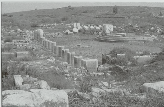
Mileto, puerto de los Leones

Toda la zona norte tenía unos límites irregulares, pues estaba condicionada por la topografía del terreno estando toda ella bordeada por el mar. Esta parte la formaban dos núcleos