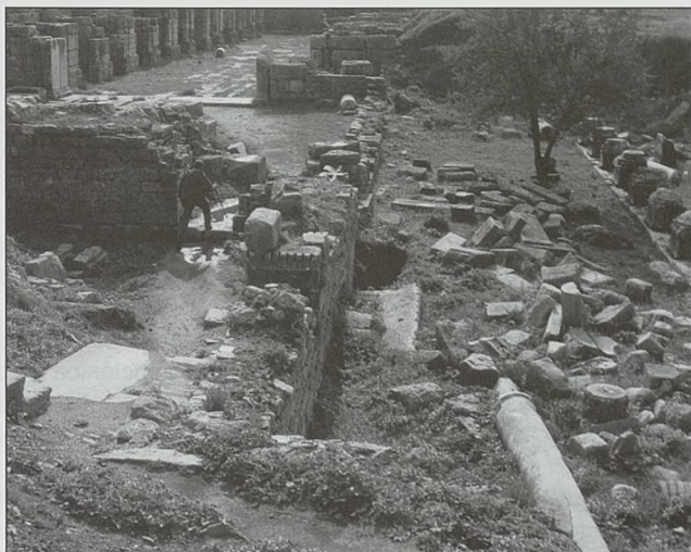
Mileto, palestra de las Termas

Finalmente, ocupando todo el espacio al sur de estos edificios hasta la "Muralla Sur", se encuentra el mayor núcleo poblacional de Mileto, el barrio sur, más puramente residencial, donde se puede apreciar un eje formado por dos calles principales que se cortan en ángulo recto, una que va de costa a costa, es decir de este a oeste, tan solo a dos manzanas de los grandes edificios públicos citados, y otra de norte a sur, que nace entre el ágora sur y las termas de Faustina, por lo que se encuentra algo desplazada al este, y llega hasta la puerta en la muralla sur donde nace la gran vía sagrada que va al templo de Apolo en Dídima. Este