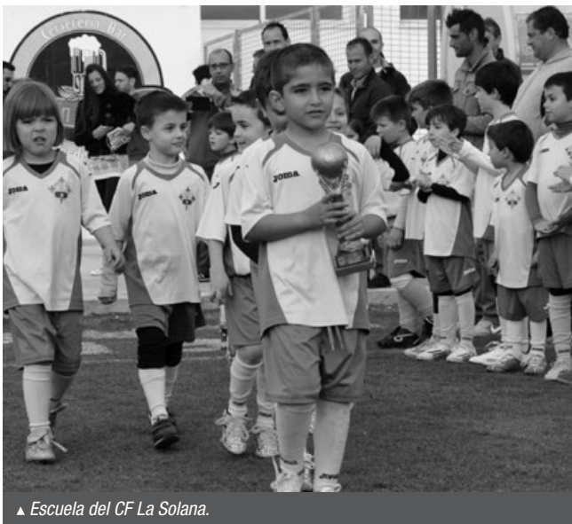
▲ Escuela del CF La Solana.