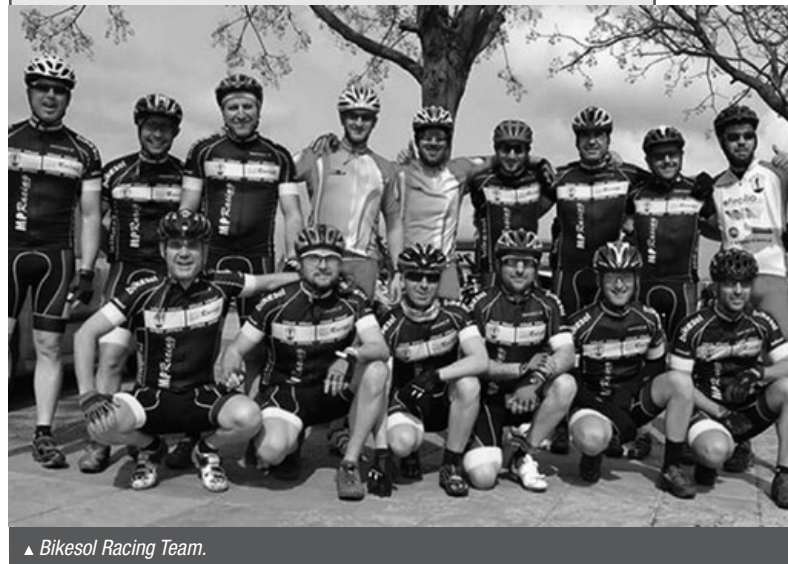
▲ Bikesol Racing Team.

nuevo equipo, que está afrontando con la máxima ilusión un exigente calendario que incluye 16 pruebas repartidas por toda la provincia. Ellos corren en la categoría Máster y, además de competir, disfrutaron cada domingo.*