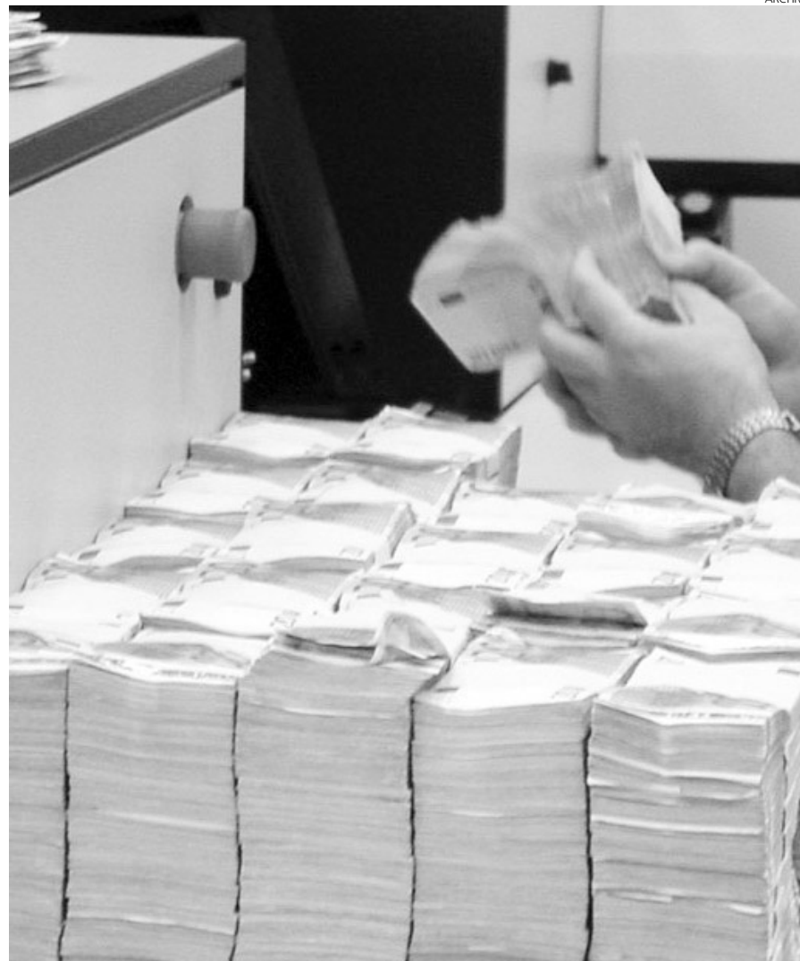
Los ingresos del Estado continúan cayendo por la crisis.

La caída de la demanda interior y de la actividad económica explican el retroceso de la recaudación en casi un 4,6% por el Impuesto sobre el Valor Añadido (IVA) en Castilla-La Mancha.