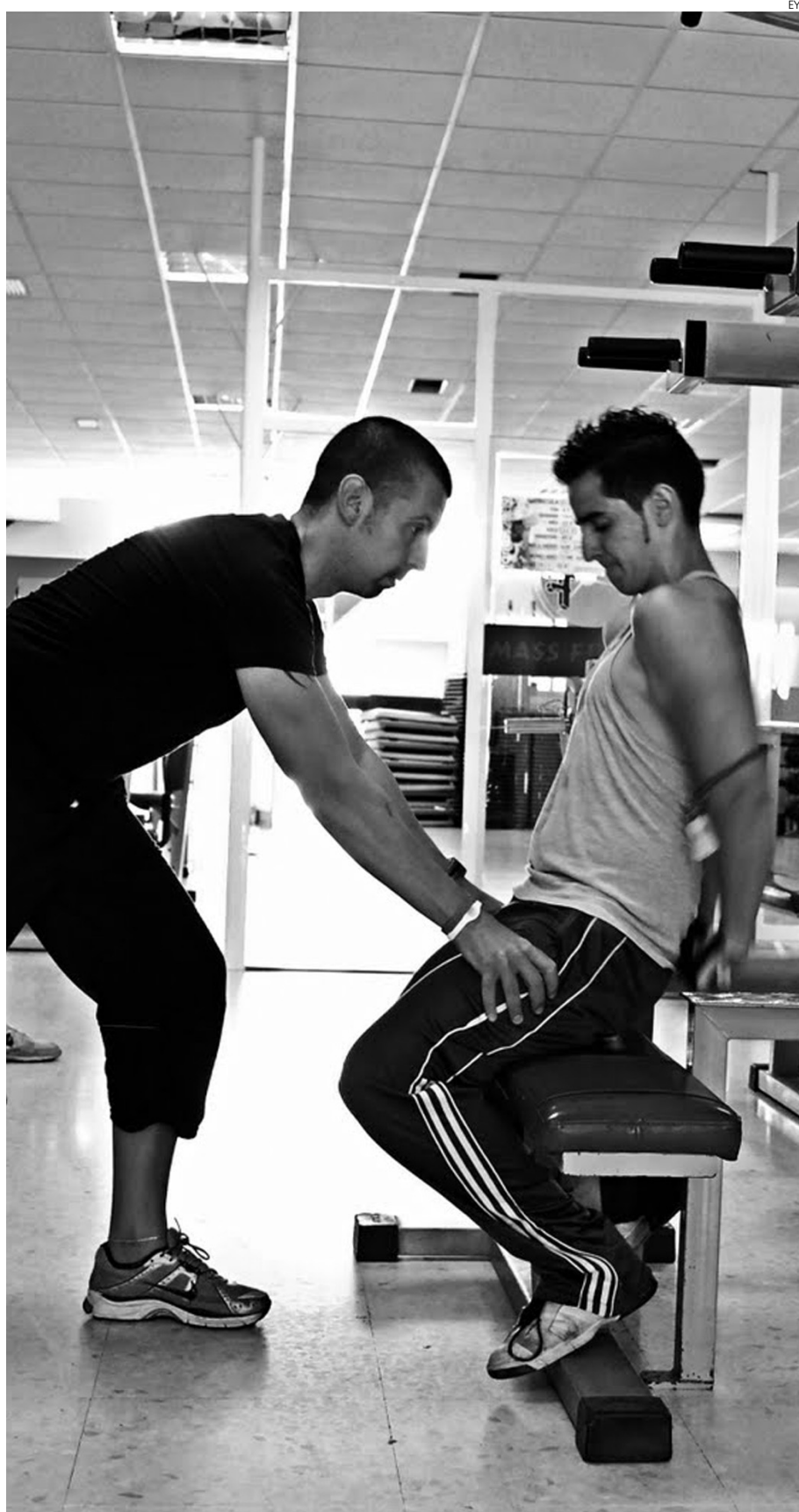
Los jóvenes se encuentran entre los colectivos con los sueldos más bajos.

Una circunstancia que, sin embargo, no impide que