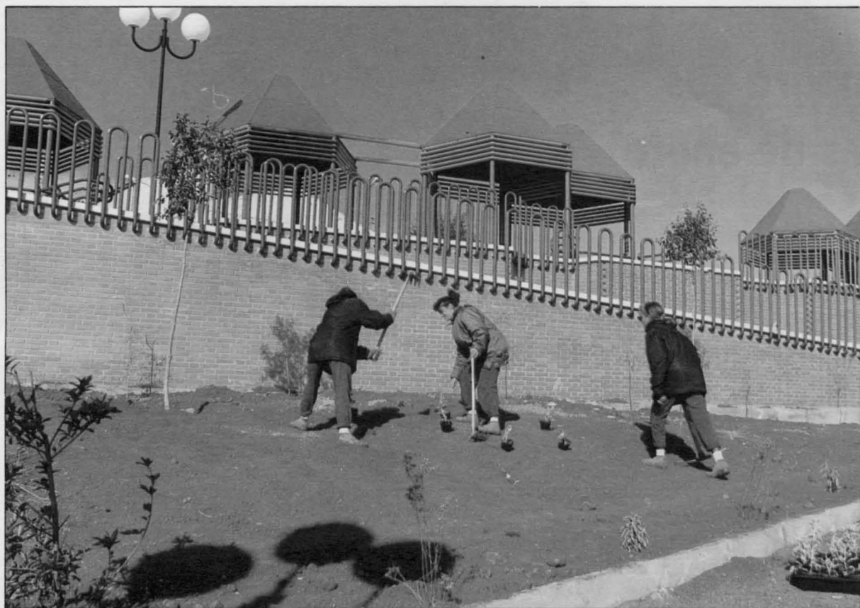
Un grupo de alumnas acondicionan la jardinería de la Plaza de la Calva