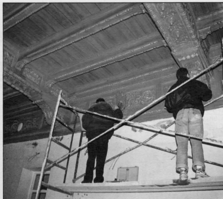
Detalle de la restauración del artesanado y paredes del interior del antiguo Ayuntamiento

Ayuntamiento subvencionará este ambicioso proyecto —que durará tres años— con 133.594.088 de pesetas, mien-