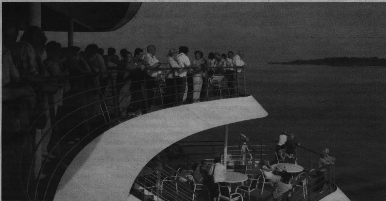
Uno de los aspectos más valorados de estas iniciativas es su organización. Muchas personas no se atreverían a hacer este tipo de viajes por su cuenta, por lo que aceptan con gran gusto la iniciativa de Caja Castilla La Mancha.