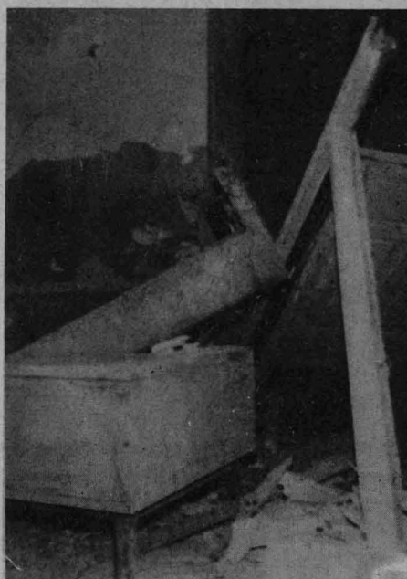
Vista parcial de las instalaciones de la c/ Caballeros, esquina Camarín

de ser la eterna y clásica excusa de la burocracia; unos pasan a otros la bola y la ver-