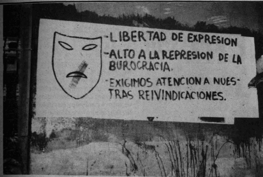
Un cartel pide se respete el derecho a la libertad de expresión y no se tachen ni arranquen dichos carteles