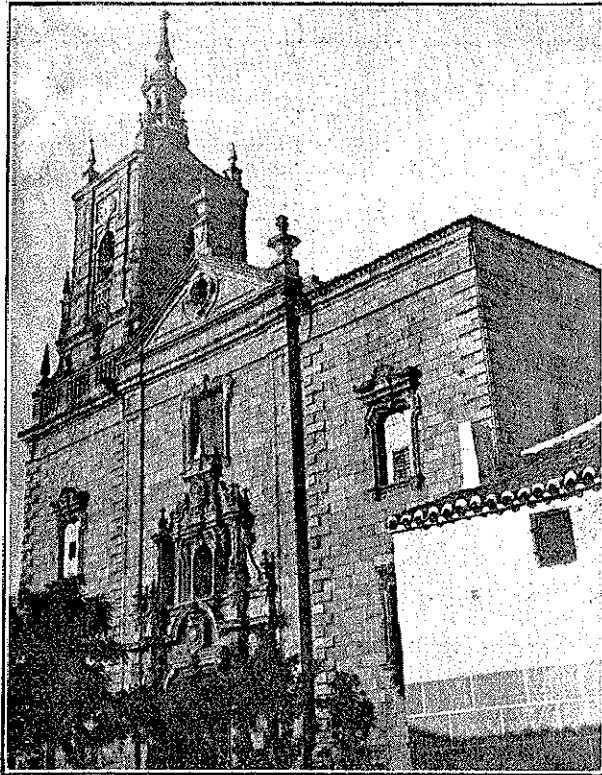
Fachada principal de la iglesia de Orgáz (Toledo)

EN la presente plana damos a conocer gráficamente la torre y la fachada principal de la iglesia de la villa de Orgáz (Toledo), pueblo pintoresco, de calles anchas, limpias, bien empedradas y de excelente urbanización.