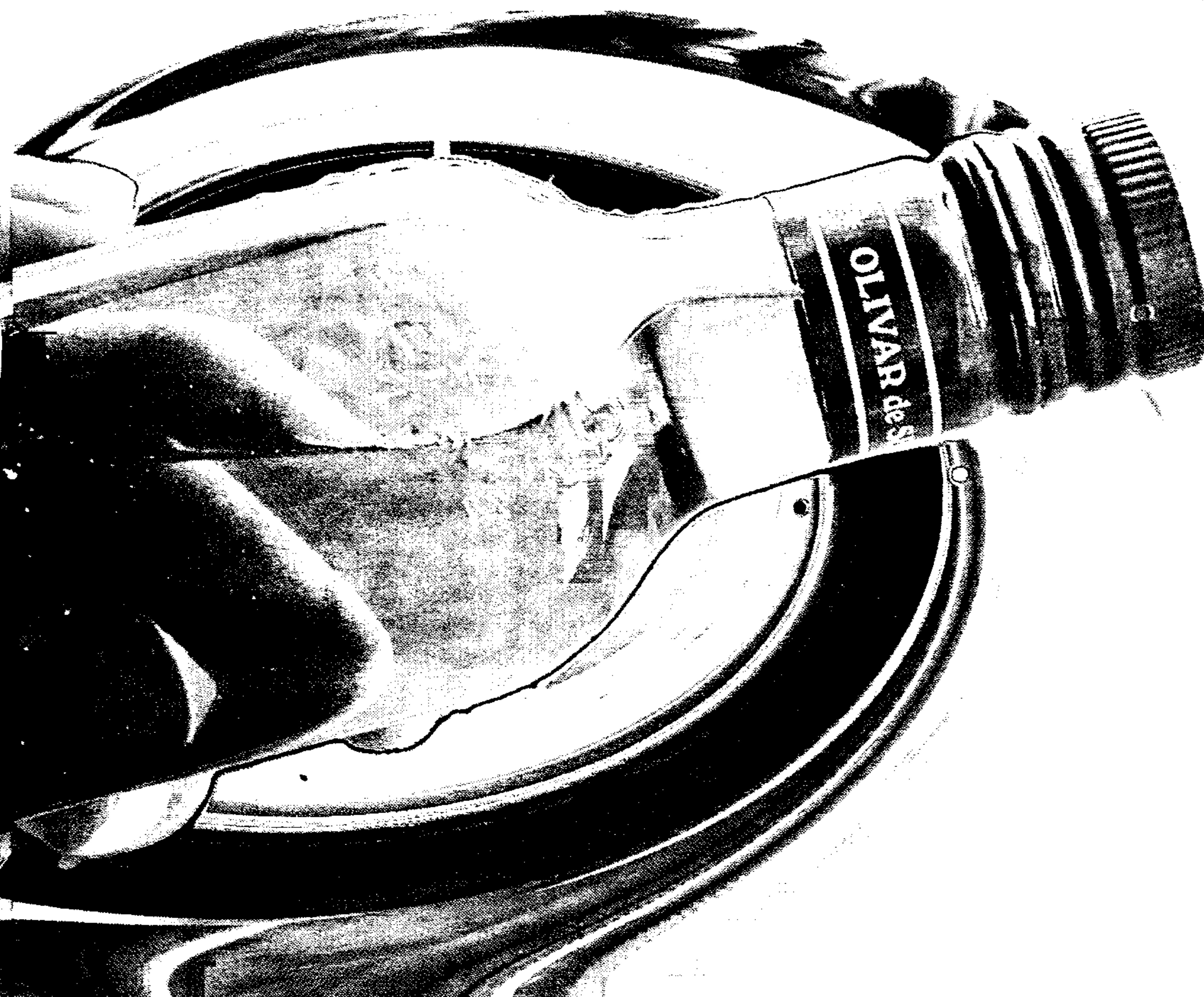
Las ventas de aceite en el exterior tendrán un crecimiento espectacular