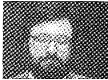
El Ministro de Defensa, Narcís Serra, tras la exposición de las conclusiones, cerrará el seminario-debate «Europa sin euromisiles»