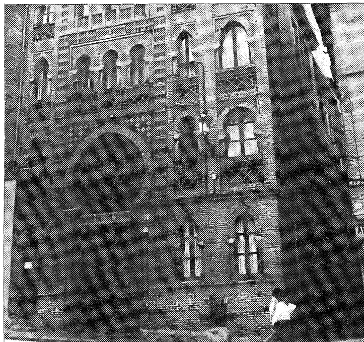
Las quejas de los empresarios toledanos ha culminado en la entrevista con Hidroeléctrica. (Foto: J. Luis Pérez).

Ante la proximidad de las fechas navideñas y la posible eventualidad de que se produzcan averías en el casco histórico, debido al alto consumo en estas festivas fechas, en el transcurso de la entrevista la Federación Empresarial solicitó que Hidroeléctrica se ponga en contacto con la misma para, siempre y cuando se pueda prever, intentar articular los horarios más adecuados que repercuta en el menor perjuicio posible. El representante de Hidroeléctrica