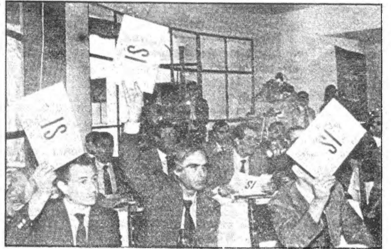
La votación del borrador presentado por UCD arrojó el siguiente resultado: 85 votos afirmativos y 1 en contra, todos de la UCD, y la "no votación" de socialistas y comunistas.

"Este proyecto de estatuto -valoró el presidente regional es un texto correcto, hecho sin prisas y adaptado a las características de nuestra región, en el marco de los pactos políticos y de las sugerencias de la comisión de expertos". "Evidentemente el texto es mejorable -siguió diciendo- y puede perfeccionarse a través de las enmiendas que hayan de presentar al mismo, en días sucesivos, los miembros de esta Asamblea de los diferentes grupos políticos".