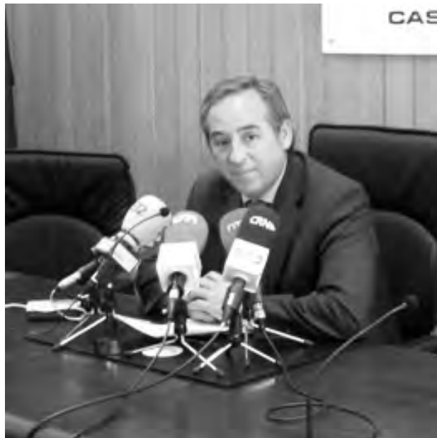
El presidente de CECAM en una de sus intervenciones.

Los datos auguran que en 2010 no se saldrá de la crisis. El paro sigue aumentando y la financiación sigue sin llegar a empresas ni a las familias, por lo que las primeras cierran y no crean empleo y las segundas dejan de consumir.