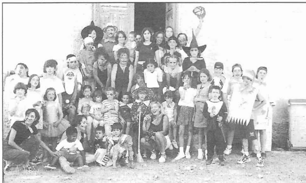
Día 10, tarde. Fiesta de despedida en la Asociación. Disfraces, maquillaje, tentempié, baileto, despedida y cierre, pero felices.

Día 9, mañana. Gynkana callejera. Con un plano del pueblo debían buscar y reali- zar pruebas varias.