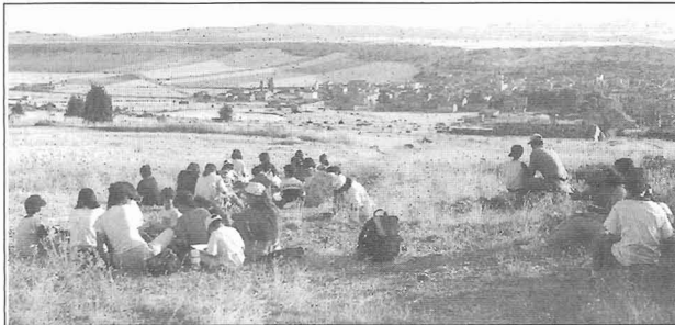
Día 9, tarde. Excursión hacia el sabinar. Conocemos el pueblo desde esta parte y lo dibujamos. Sus dibujos se expusieron en el local.