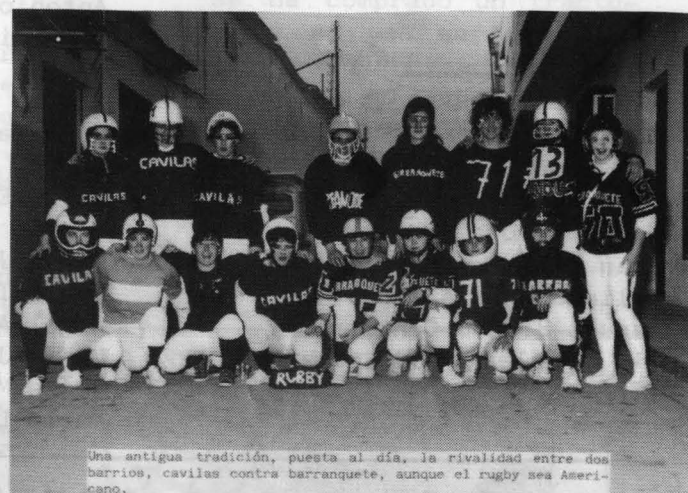
Una antigua tradición, puesta al día, la rivalidad entre dos barrios, cavilas contra barranquete, aunque el rugby sea Americano.