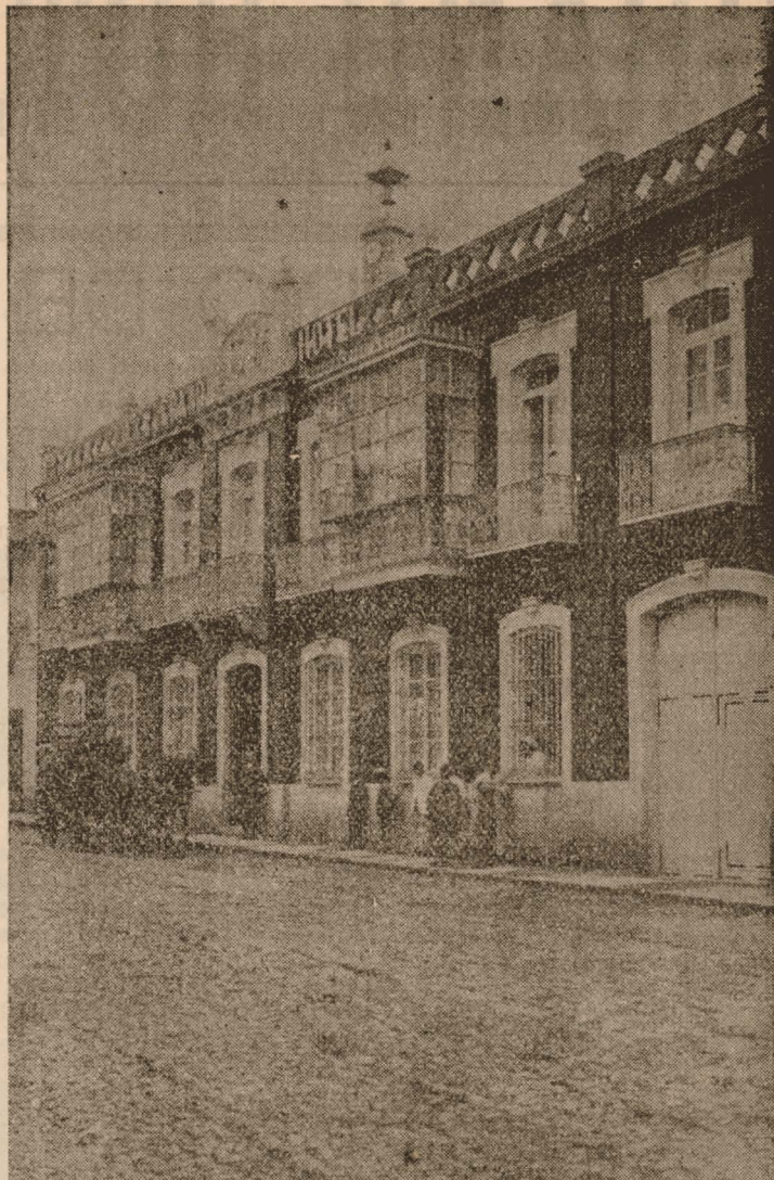
Fachada del GRAND HOTEL de Ciudad Real.

la Mancha entera, publicando el presente extraordinario como homenaje á nuestra Patrona, como homenaje á la Ciudad, como homenaje á la provincia cuyas representaciones aquí se congregan y como homenaje también de gratitud á los lectores que durante treinta y ocho años han venido sosteniendo al veterano LABRIEGO hoy transformado, si, con arreglos á nuevas corrientes, con vistas á nuevas orientaciones, pero nutrido en la misma inspiración tradicional, hacia ideales que siempre fueron su norte.