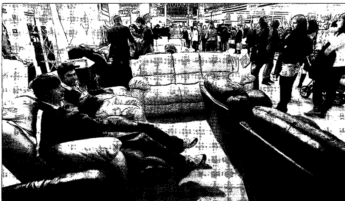
El pabellón se ha llenado de gente hasta el último día de feria, como se aprecia en esta imagen de ayer.