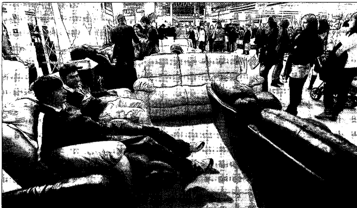
El pabellón se ha llenado de gente hasta el último día de feria, como se aprecia en esta imagen de ayer.