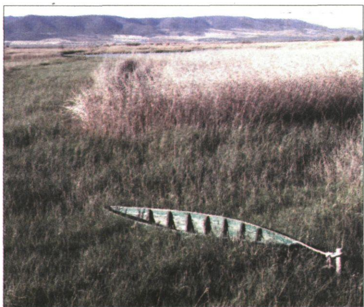
Las Tablas de Daimiel afectadas por la sequía.