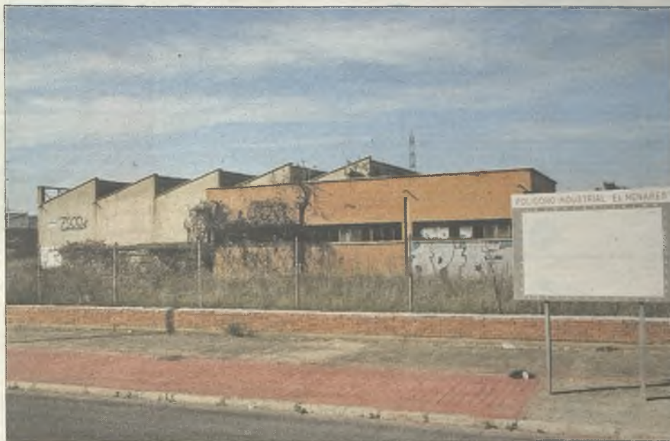
Decenas de industrias cerradas en Guadalajara hacen necesario el plan de reindustrialización.

La negativa del PP a que el Corredor del Henares en la provincia de Guadalajara tenga un plan de reindustrialización no tiene ninguna explicación lógica: en los Presupuestos del Estado hay una partida genérica para este fin de 409 millones de euros y, en los mismos años que se le ha negado a Guadalajara, se han aprobado planes de reindustrialización, por ejemplo, para