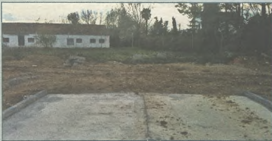
Vial interrumpido en El Ruiseñor por edificios que el alcalde se negó a expropiar.