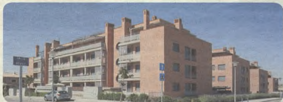
C. de Brasil, 13

JORNADA DE PUERTAS ABIERTAS 13 de diciembre, de 10 a 14 h