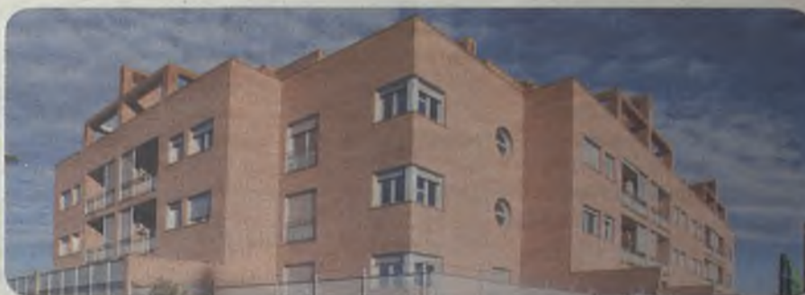
C. Cerro de Hita, 7