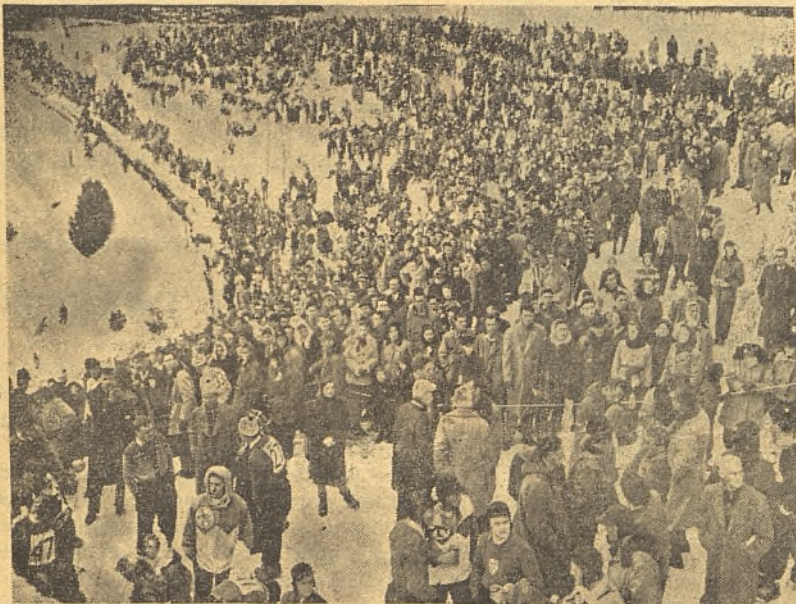
El público contempla una de las pruebas.

pinistas, se deberá principalmente a la labor desarrollada por ese pueblo y por la Universidad de Dartmouth. Culminación de esa labor son los Juegos de Invierno que se celebran en esa localidad, coincidiendo con el Carnaval.