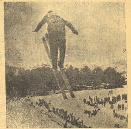
Este alpinista obtuvo el primer premio en saltos con esquí, en los Juegos de 1948

Otro concurso, de carácter pintoresco, que tiene lugar esos días es el de esculturas de nieve, algunas de las cuales son verdaderamente notables. En 1950 ganó el primer premio una figura