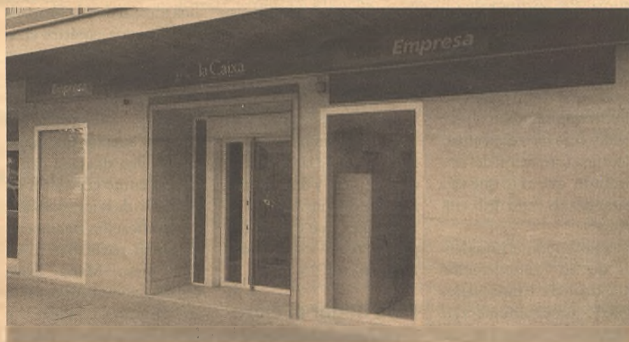
La Caixa empresas ha abierto recientemente en Guadalajara.

Con el objetivo de estar más cerca de sus clientes, la entidad abre su nuevo Centro de Empresas en la calle Virgen de la Amparo, en el centro de la ciudad de Guadalajara