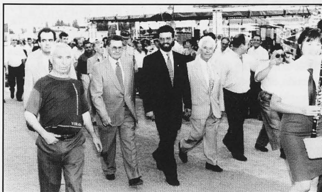
Las autoridades visitaron el ferial el día de la inauguración.

Y por estas cosas sobre todo la feria 95 será una de las que pasará a la historia de las solaneras de Santiago y Santa Ana.