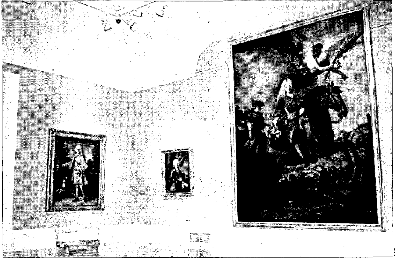
CON LUZ PROPIA Una de las salas del museo, ilumina con luz natural tras las recientes modificaciones que han experimentado las cubiertas del edificio.

Real Patronato el pasado mes de abril, ha recibido un fuerte impulso con el acuerdo alcanzado recientemente entre la Iglesia y el Estado para la utilización del claustro de los Jerónimos, que está pendiente del visto bueno de la Santa Sede.