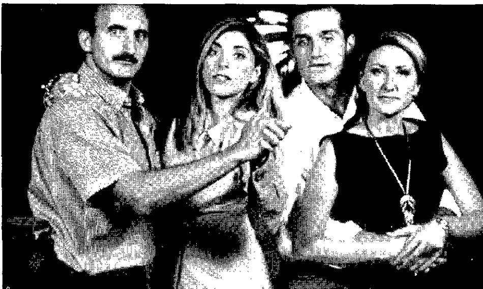
FELICES Parte del equipo de 'Madrid directo'.