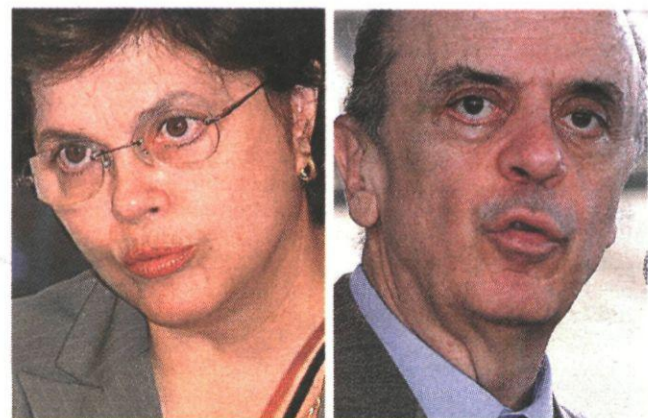
Rousseff (del socialista PT) y Serra (del liberal PSDB).

Brasil ❖ Comienza la lucha por liderar a una de las grandes potencias del futuro ■ P27