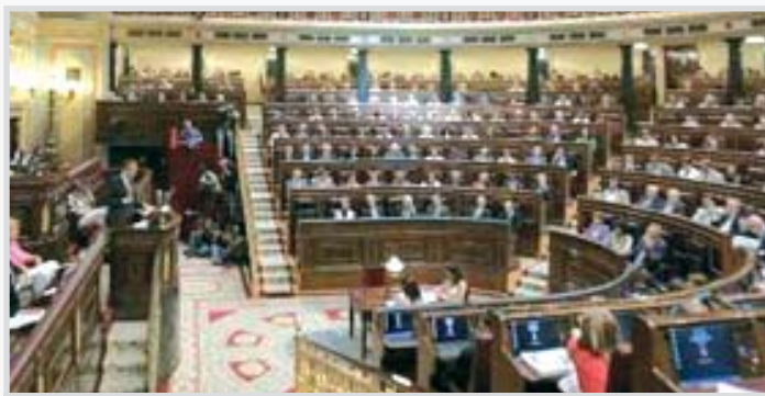
Imagen de la sesión del Congreso de los Diputados