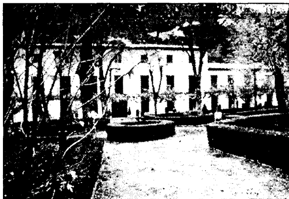
El Balneario seguirá siendo el estandarte de Solán de Cabras.

millones de pesetas, de los que casi el 70% correspondieron al segmento de alimentación. En este sentido, el objetivo a corto plazo es potenciar el canal hostelero, para lo que se está estudiando dar un