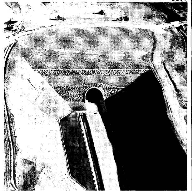
Vista aérea del túnel de Villargordo.