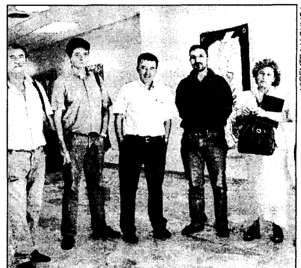
En la imagen, los representantes sindicales de Unilever.

del marco del problema laboral que se verificaría de llevarse a cabo el cierre de la fábrica, afirmó que la Junta "ha solicitado e instado, que se produzca de forma consensuada y pactada con los trabajadores, para que, como ha ocurrido en otros procesos anteriores se garanticen todas las condiciones de trabajo que ahora tienen".