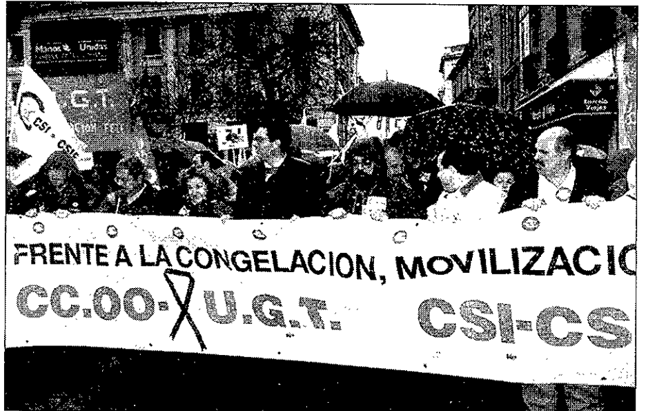
Imágenes como esta pueden volver a repetirse de no desbloquearse la negociación en el sector.

En la mesa general de negociación, convocada el