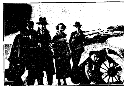
Los intrépidos excursionistas ven compensado su disgusto con la belleza femenina.