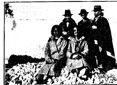
En los expresivos rostros se ve la satisfacción de los amigos del campo.