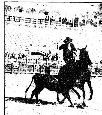
Vease la gallardia de un campero andaluz