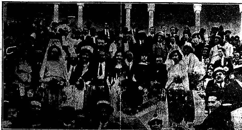
Bellas señoritas que presidieron la becerrada dándole realce con su prestancia maja

La Cruz Roja es de las asociaciones benéficas una de las que gozan de mas simpatía. Su emblema pudiera ser un corazón de mujer.