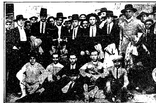
Los emulos de Cúchares que integraron las cuadrillas