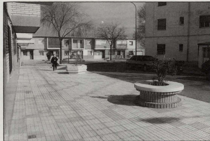
Los espacios libres de las 630.

se considera que no deben realizarse ninguna más en viviendas unifamiliares, por lo que en el proyecto se ha tratado de evitar el acceso directo de vehículos a zonas de fachadas y paredes laterales en las viviendas.