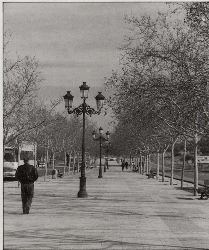
Pavimentación y zonas verdes.

Igualmente se realizará el máximo número de aparcamientos sin que se disminuyan considerablemente las zonas de estancia. Los accesos de vehículos no serán vías de circulación. Las cocheras existentes serán respetadas. Sin embargo,