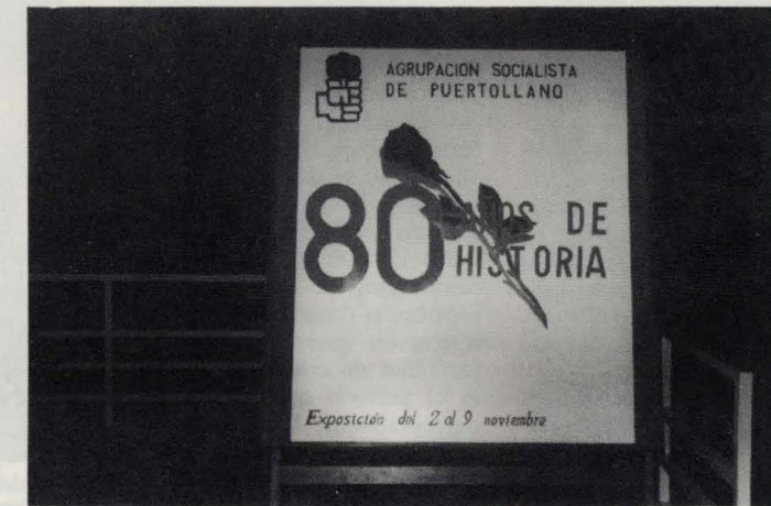
Los actos puntuales y la exposición se celebrará, como viene siendo habitual, en la Casa Municipal de Cultura.

El valor de la exposición radica, por una parte, en la magnífica labor de recopilación documental (periódicos de las distintas épocas, cartas, fotografías, carteles, etcétera), utilizable para trabajos de historia. Por otro lado, porque supone una contribución y aportación al conocimiento de la historia local, tanto en su aspecto