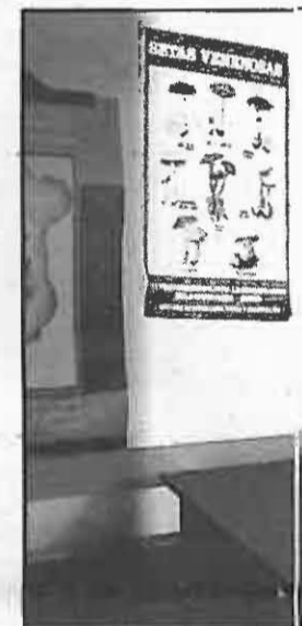
El Taller de Ecología, un curso.