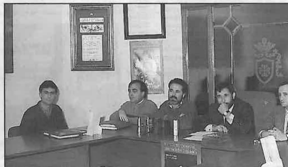
En 1987 fuimos anfitriones de IV Encuentro Provincial de UU.PP.