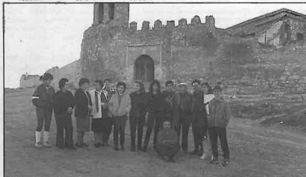
El Aula de Estudios en las ruinas de Alarcos. (1986)