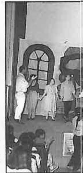
Grupo de Ballet durante un curso.