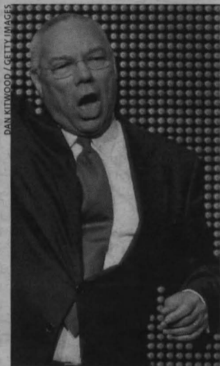
Powell (izda), el 14 de octubre. Obama, bailando en 2007.

La decisión no extrañó ni a McCain, que encajó el golpe con una sonrisa ("Seguiremos siendo amigos", dijo), ni a los analistas políticos. Es sabido que Powell forma parte de los republicanos