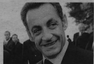
Sarkozy denunció la estafa.

FRANCIA. Las nuevas tecnologías permiten que cualquiera pueda ser víctima de una estafa. Incluso el mismísimo presidente francés, Nicolas Sarkozy. El diario Le Journal de Dimanche reveló ayer cómo el jefe del Estado galo denunció en septiembre haber sido víctima de un grupo de timadores que consiguieron los datos de una de sus tarjetas de crédito. Utilizando los números que aparecen en la tarjeta, se dedicaron a comprar por Internet objetos de un valor no muy elevado con la esperanza de que el presidente no se daría cuenta. Sarkozy sí que lo advirtió