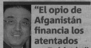
"El opio de Afganistán financia los atentados en Pakistán" Asif Ali Zardari Presidente de Pakistán

ASESINATO. No está claro si eran civiles (como afirma el Gobierno) o soldados (como dicen los rebeldes). Tampoco si de los 50 pasajeros, han sido asesinados un total de 40, de 31 o de 27. Pero sí se sabe que, tras secuestrar el jueves a 50 pasajeros de varios autobuses, los talibanes ejecutaron este fin de semana a la mayoría de ellos.