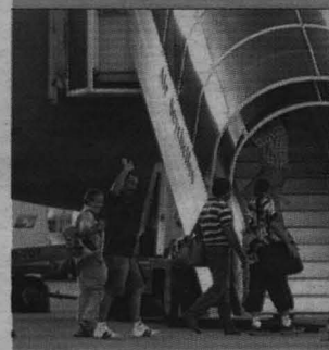
Los marineros suben al avión que les llevará a Madrid.