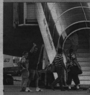
Los marineros suben al avión que les llevará a Madrid.