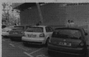
Varios de los coches intervenidos.