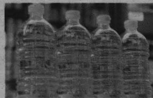
Botellas de aceite de girasol.