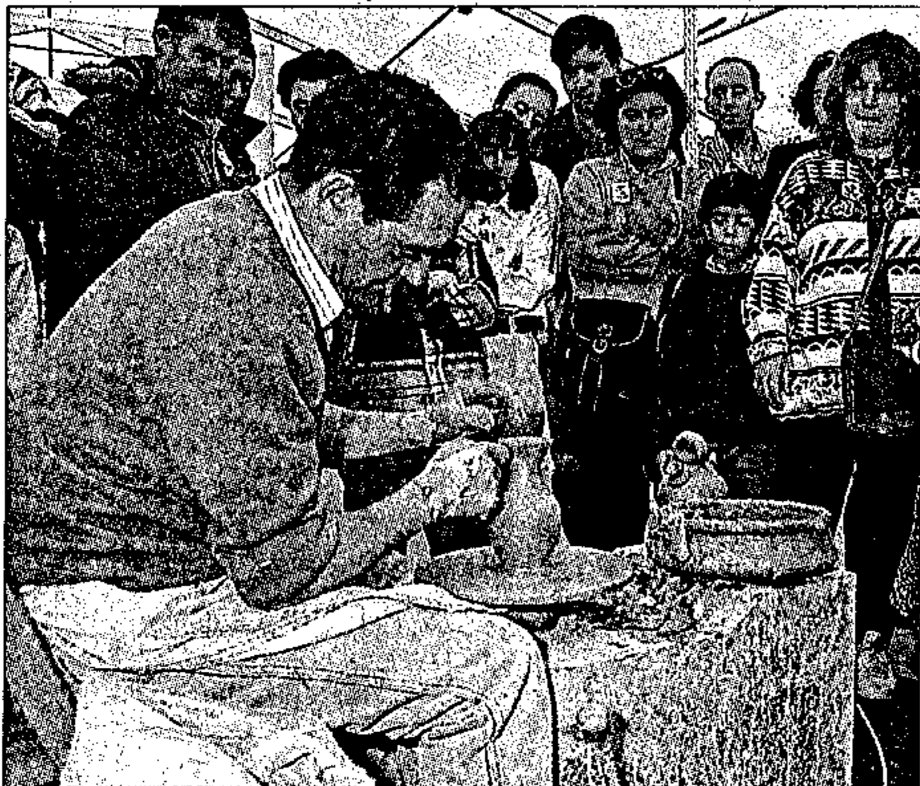
Los excelentes profesionales que existen permitirán recuperar el prestigio

Ambas iniciativas, surgidas de diferentes sectores e instituciones, pueden ser, según Núñez, un revulsivo importante para la consolidación de este renaciente prestigio de una actividad tan importante y ancestral en Talavera como es la cerámica. En el primer caso, la feria se prevé llevar a cabo a mediados de año, y para ello se espera contar con el sector de todo el país. La asociación ha enviado encuestas a profesionales de toda España con el objetivo de determinar la aceptación que tendría el evento y los criterios