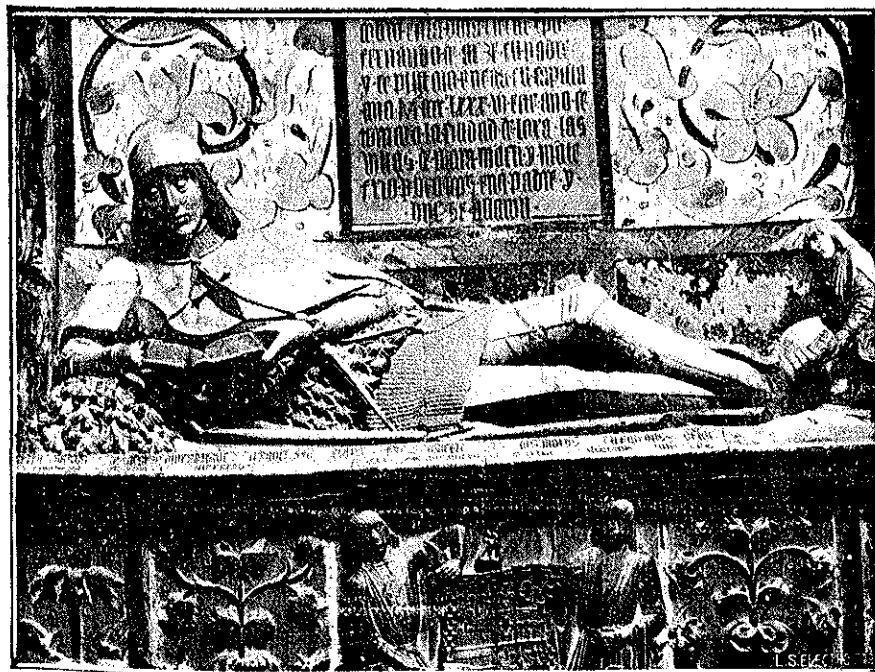
«El doncel del libro», maravillosa obra de arte que existe en la Catedral de Sigüenza.

sucesivamente, a los ricos pueblos castellanos. Comenzamos esta tarea, con Sigüenza, uno de los más importantes pueblos de Guadalajara.