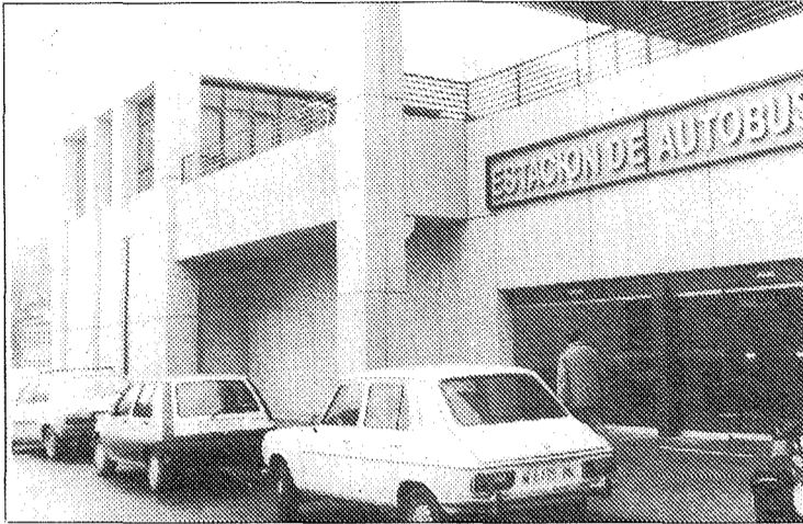
Los lunes y los viernes son los días en los que más viajeros pasan por la estación, cerca de 8.500.

Para Julio Rodríguez la mayoría de las localidades de nuestra provincia están bien comunicadas con Toledo, «practicamente todos los pueblos están comunicados con Toledo. En algunos puntos determinados, logicamente dependiendo de su densidad de población, tendrán mas comunicación que otros. Practicamente en todos los pueblos en un momento del día hay algún autocar que pasa». La única excepción de la que podríamos hablar es la de los pueblos de la zona de Talavera, que tienen su principal comunicación con esta y su contacto con Toledo lo tienen a través de Talavera. La otra parte alejada de Toledo, la manchega, también tiene unas líneas de transporte adecuadas a las necesidades de localidades