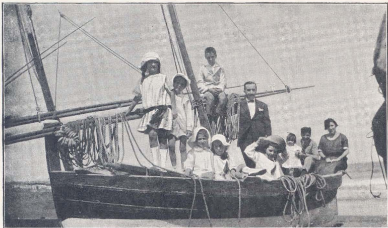
A Puerto Rico en un cascarón de nuez.