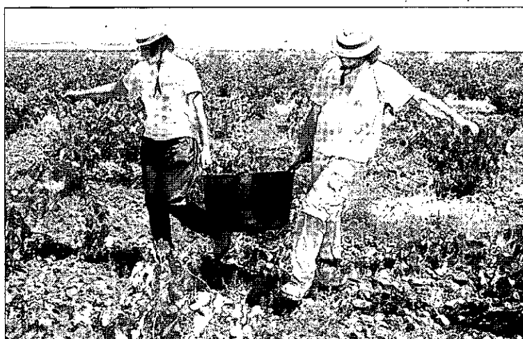
Dos personas trabajan durante la campaña de la vendimia.

DIÁLOGO SOCIAL. Así mismo, Jiménez indicó que «empresarios y sindicatos han de trabajar de manera conjunta y a través del diálogo social para cambiar el modelo productivo, que hasta ahora ha estado basado en el ladrillo». «Si no lo hacemos difícilmente vamos a salir de este agujero», sentenció.