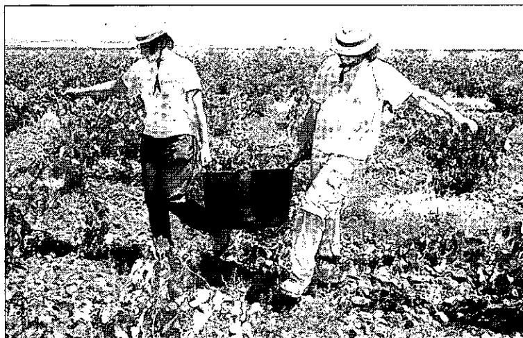
Dos personas trabajan durante la campaña de la vendimia.

DIÁLOGO SOCIAL. Así mismo, Jiménez indicó que «empresarios y sindicatos han de trabajar de manera conjunta y a través del diálogo social para cambiar el modelo productivo, que hasta ahora ha estado basado en el ladrillo». «Si no lo hacemos difícilmente vamos a salir de este agujero», sentenció.