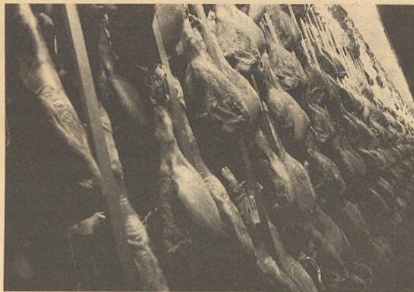
Los productos regionales son muy demandados en el exterior.

que en España este aumento ha sido de tan solo el 3,8%. Esos mismos datos evidencian que las ventas de las empresas de la región en el mes de octubre han aumentado un 8,9% respecto a las del año anterior para el mismo mes, mientras que las del total nacional han descendido un 0,8%. "Con este dinamismo -aseguró Laviña-, es muy posible que superemos con holgura la barrera de los 5.000 millones en las exportaciones, lo que supondría una gran cifra para nuestras empresas".