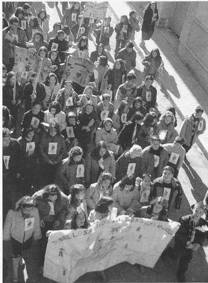
Imagen de la manifestación que recorrió las calles de La Solana.

De cara al público, la inauguración se celebró el lunes 26 con la apertura de una exposición fotográfica titulada “In-